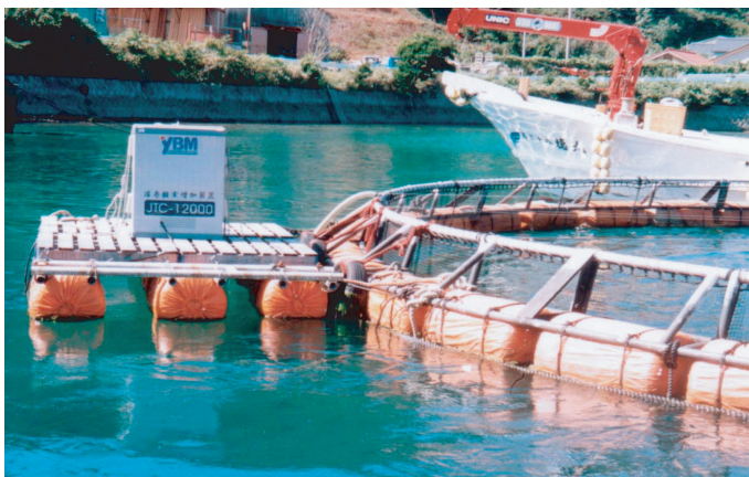
ハマチ養殖網へのJTC-12000W設置状況